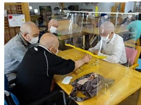
将棋で勝負 白熱中です