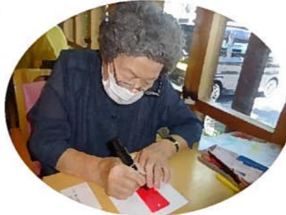
願いごと「なにを書こうかな？」