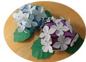
折紙で紫陽花作り テーブル等に飾ってます