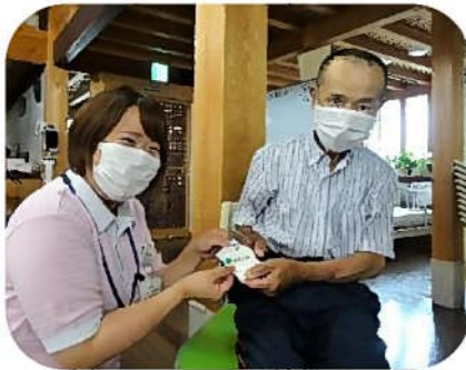
父の日のプレゼント「いつもありがとうございます。」